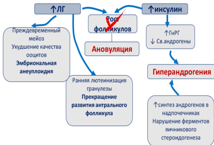
Рис. 2. Роль гиперинсулинемии и лютеинизирующего гормона в патогенезе синдрома поликистозных яичников (40).

Ключевым нарушением действия инсулина на молекулярно-биологическом уровне считается пострецепторный дефект начальных этапов сигнальной трансдукции. При СПКЯ наблюдаются нарушения продукции мембранных переносчиков глюкозы, а также регуляции липогенеза. МИ и ДХИ, будучи медиаторами передачи клеточного сигнала, выступают регуляторами этих нарушений.